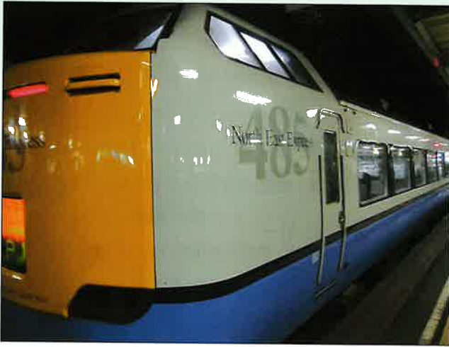
세이칸터널을 운행중인 485계 개조차량. 'North East Express'라는 애칭을 가지고 있다.